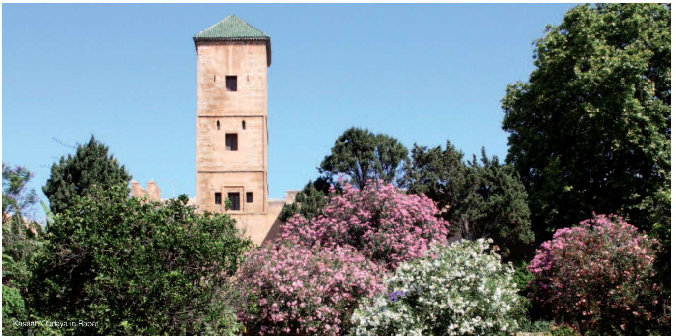
Kasbah Oudaya in Rabat