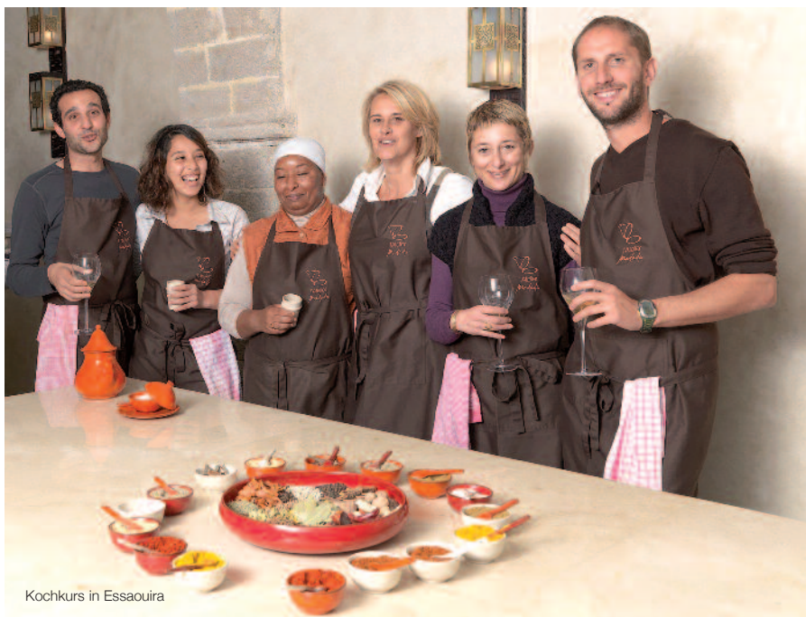
Kochkurs in Essaouira